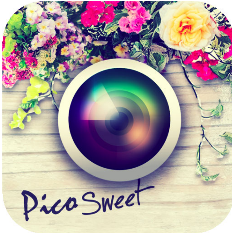
「Pico Sweet - ピコ・スイート」アイコン

有限会社アンジー(所在地：東京都千代田区、代表取締役：森 英信)が提供しているiPhone用写真加工アプリ「Pico Sweet - ピコ・スイート」が、2013年12月31日(火)付で100万ダウンロードを突破しました。