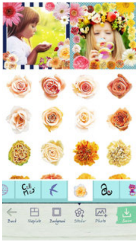
無料配信スタンプ1