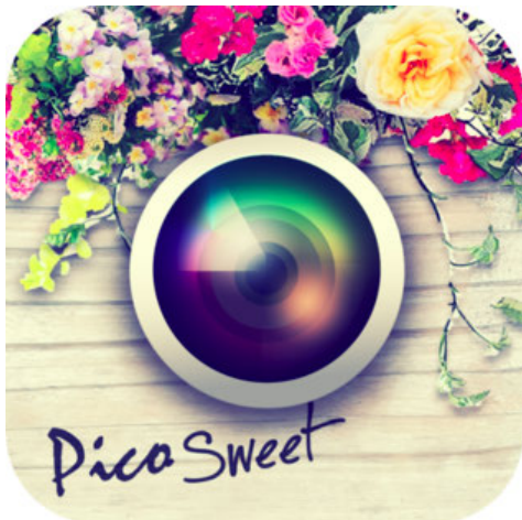
「Pico Sweet - ピコ・スイート」アイコン