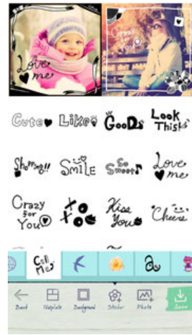
無料配信スタンプ2